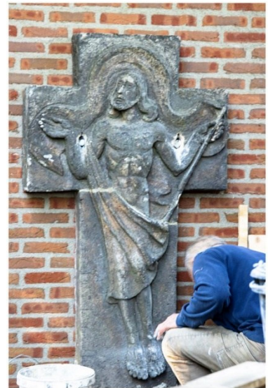
Kruis op het Tegelse kerkhof