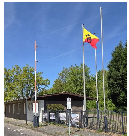
Aan de grens bij Heidenend wappert sinds kort de grote Tegelse vlag

De huidige vlag is gebaseerd op een ontwerp van de Utrechtse vlaggendskundige J.F. van Heijningen. Omdat de voorgaande vlag te veel gelijkenis toonde met de Belgische en Duitse vlag, baseerde hij zijn ontwerp op drie kenmerken: diagonale vlakverdeling, symbool voor Sint-Maarten, die als beschermheilige voor Tegelen geldt. Daarbij is de diagonaal van mastzijde naar buitenzijde oplopend: dit verbeeldt het hoogteverschil tussen Maas en Maasterras. De kleuren zijn hetzelfde als van de voorgaande vlag, aangezien deze verwijzen naar het gemeentewapen. Hierbij verwijzen de kleuren rood en geel naar de grondkleuren van de originele vlag uit 1938 en het gemeentewapen. En de getongde en geklauwde zwarte leeuw verwijst naar de historische band met Gulik. De Hoge Raad van Adel stelde, desgevraagd, dat de Gulikse leeuw centraal op de vlag moest worden geplaatst, van aanzienlijk postuur. Tijdens de gemeenteraadsvergadering van 30 mei 1991 werd het ontwerp van de nieuwe vlag vastgesteld.